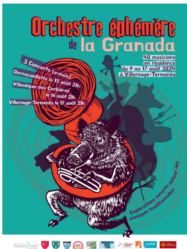
Affiche de l'orchestre éphémère 2024.